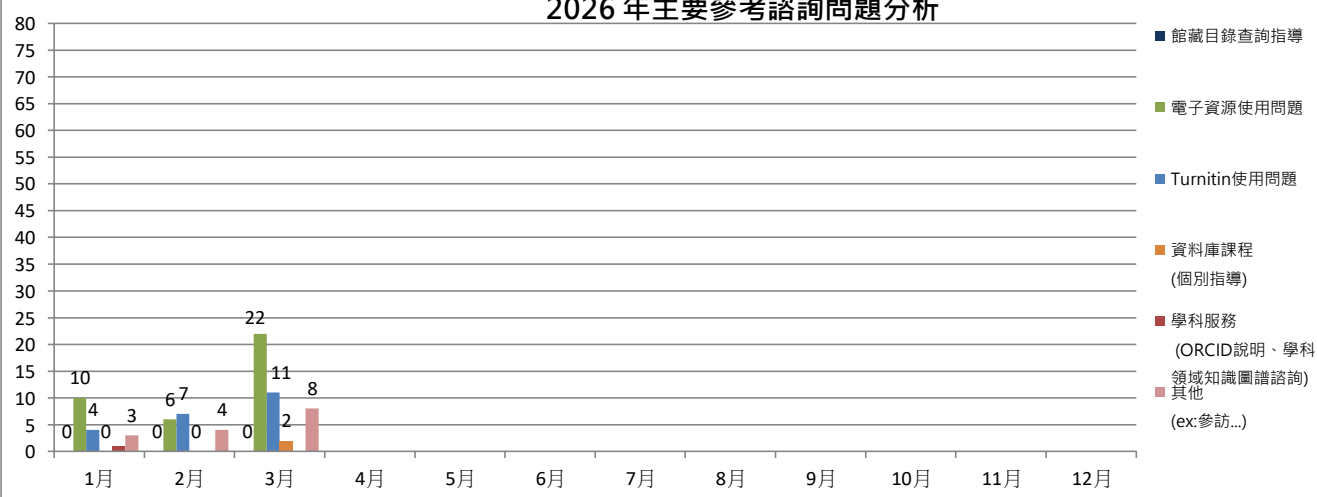
2026 年主要參考諮詢問題分析